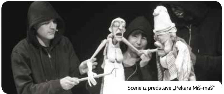
Scene iz predstave „Pekara Miš-maš“

„MARTINKO“, POZORIŠTE LUTAKA „KOLOBOK“, VOLGOGRAD, RUSIJA