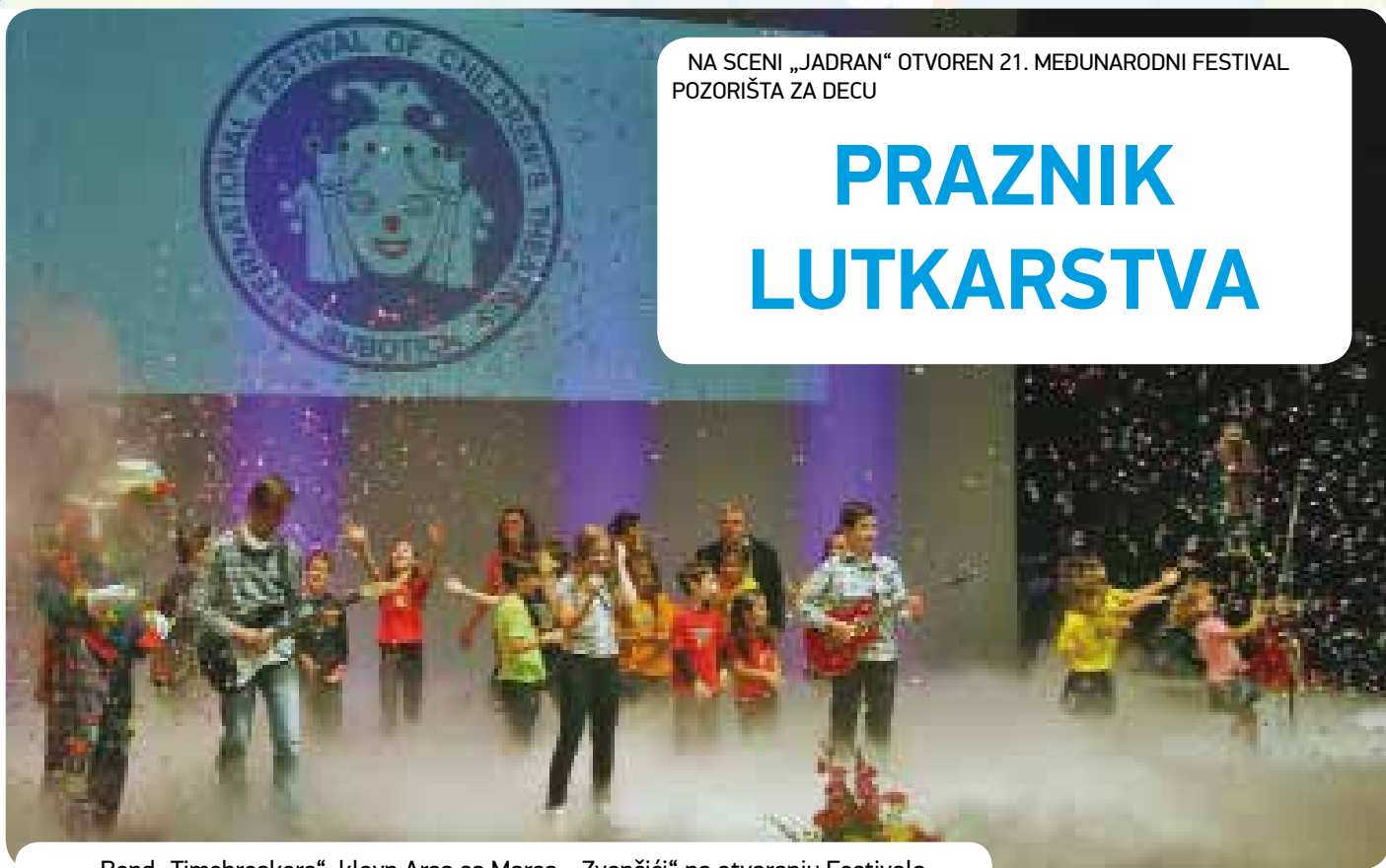
Bend „Timebreakers“, klovn Arsa sa Marsa, „Zvončići“ na otvaranju Festivala

Festivalskom himnom koju je izveo dečki hor „Zvončići“ iz Novog Sada, na sceni „Jadran“ Narodnog pozorišta, podignuta je zavesa 21. Međunarodnog festivala pozorišta za decu.