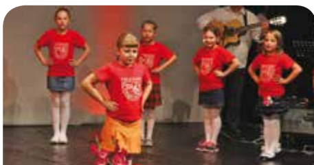
Najmlađi članovi OKUD „Mladost“ iz Subotice