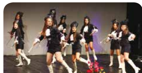
Mažoretkinje plesne grupe „Alisa“ iz Kotora