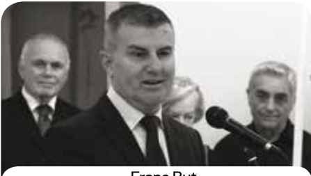
Franc But ambasador Slovenije u Srbiji

U prepunoj Modernoj galeriji „Likovni susret“ postavljena je izložba „Sto godina slovenačke lutkarske umetnosti“. Autori ove predivne izložbe su Agata Frajer i Edi Majaron, a postavka sadrži izbor od više od dve stotine lutaka, dela najznačajnijih slovenačkih likovnih umetnika, koji su oblikovali lutke za slovenačka pozorišta lutaka od početka prošlog veka do danas.