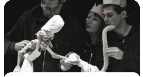
Scene iz predstave „Pekara Miš-maš“

Ističući da je Subotica, u kojoj je bila osamdesetih godina prošlog veka, prelepa, glumica kaže da joj je samo žao što su se već posle predstave morali vratiti u Ljubljana.