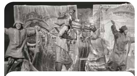
Scene iz predstave „Martinko“